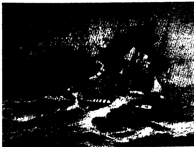
Maleri af Fregatten Jylland i høj sø

Da Fregatten forlod Leith, blev Kursen sat paa Lindesnæs, og for en frisk vestlig Brise stod Fregatten Skagerak ind. Den Nat, da Skagen skulde anduves, stod det med svære Byger på Hundevagten. Bramsejl og Undersejl var bjærgede, og utallige Gange maatte Mørssejlene fires paa Rand. Den vagthavende Officer stod paa Vagtbænken med Raaberen i Haanden, klar til at tage mod Bygerne. Under en af disse ringede Chefen til Dækket og gav Ordre til at rebe. Vagtchefen mente dog ikke, at det var nødvendigt at mindske Sejlføringen og havde just sendt Styrmanden ind til Chefen for at gøre denne bekendt med sit Syn paa Sagerne, da en ny voldsom Byge krængede Fregatten over, saa de læ Batterikanoner slæbte i Vandet.